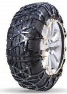
ウレタン&ゴムチェーンタイプ