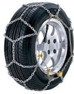
金属チェーン「亀甲型」タイプ