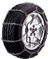
金属チェーン「はしご型」タイプ

※ただし、スプレーのように薬剤を吹き付けるタイプのものではチェーン規制中に通ることは できません。