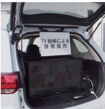
TV放映による情報提供