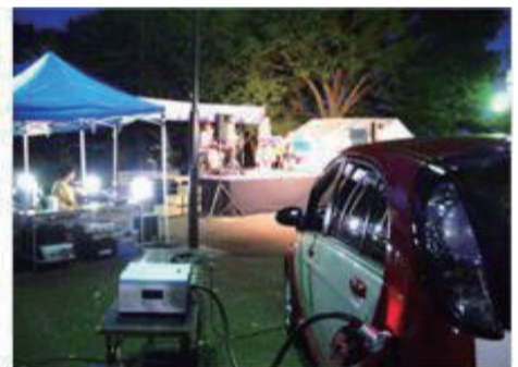
集会等での音響機器への給電