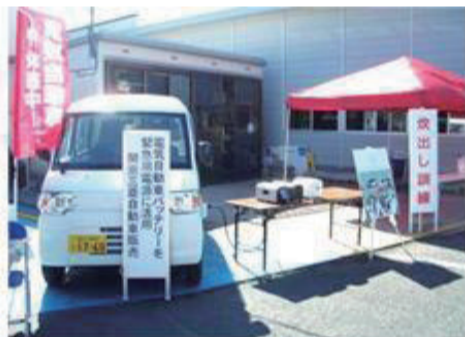
家電製品への給電