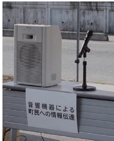
集会等で音響機器に給電し情報伝達ができます